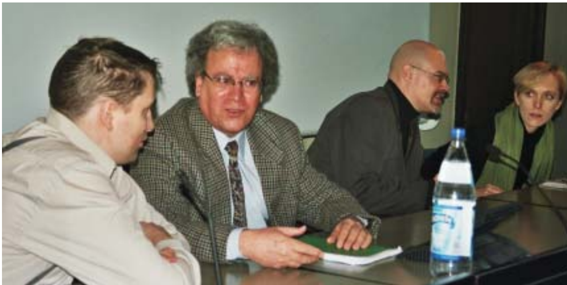
Vapaa-ajattelijain liiton islamseminaari keräsi salin täyteen kuulijoita Tieteiden talossa Helsingissä 16. helmikuuta (kuva ed. sivulla).