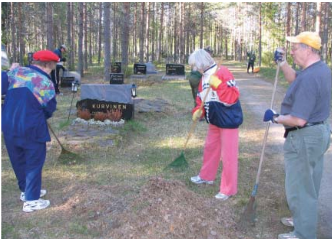
Tuonenviidasta tuli taas siisti talkootyönä.