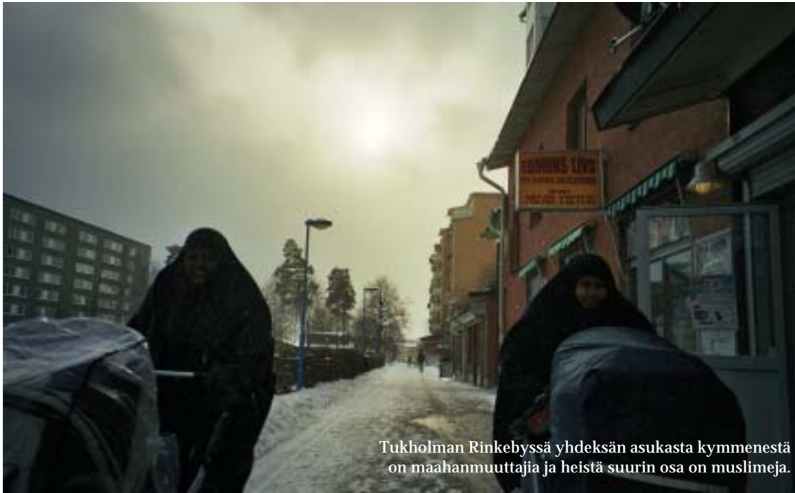
Tukholman Rinkebyssä yhdeksän asukasta kymmenestä on maahanmuuttajia ja heistä suurin osa on muslimeja.

istuu kymmenkunta pohjoisafrikkalaista miestä. Kovääninen seurustelu peittäisi taustamusiikin, jos sellaista kuuluisi. Katutason liiketiloista leijonanosan vie naisten vaatetus ja kauneudenhoito. Tuotteet näyttävät edullisilta. Naisia ei kuitenkaan näy. Myyjät istuskelevat kassakoneiden takana kännyköitään näpelöiden.