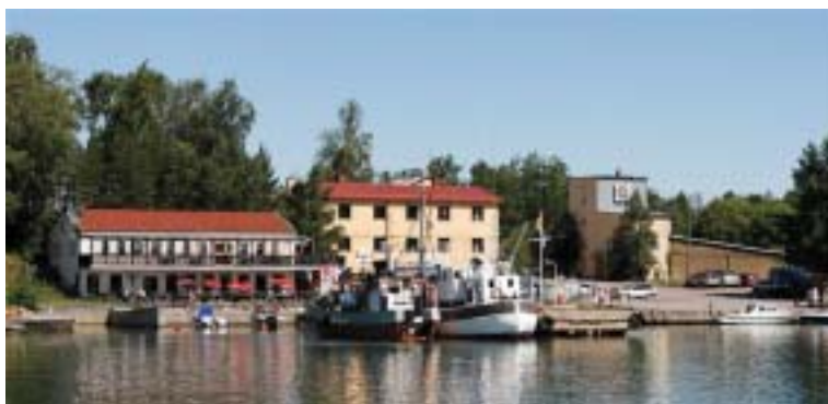
Raision venesatamassa Aina-laiva odottaa turkulaisia ja raisiolaisia vapaa-ajattelijoita.