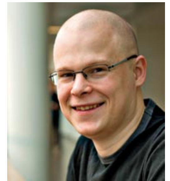
Kirjoittaja on Eroakirkosta.fi:n tiedottaja.