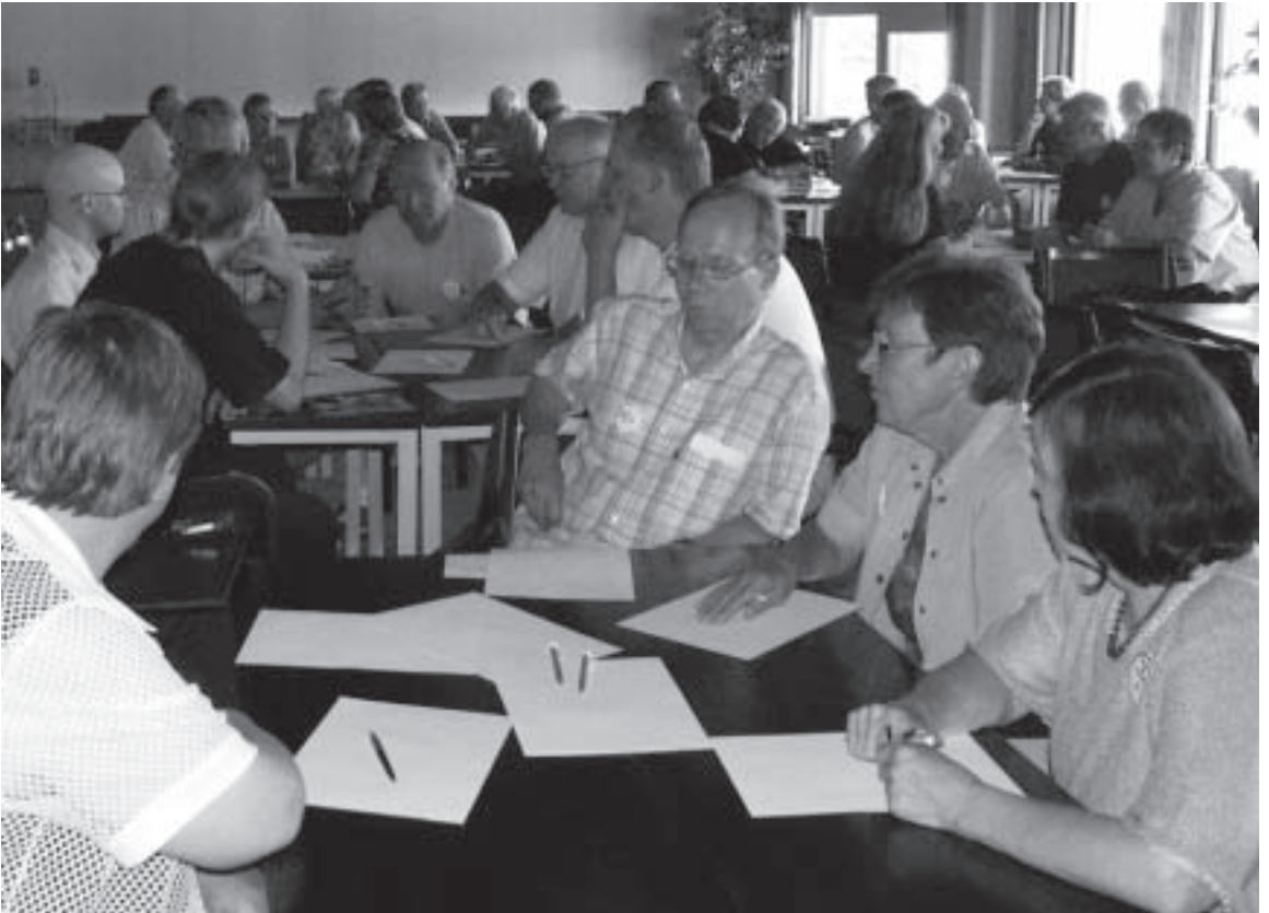
Vapaa-ajattelijat pohtivat kesäpäivillä muun muassa vapaa-ajattelijakäsitteen ja historian selkiyttämistä sekä lainsäädäntötietäystä.

Keskeisimpinä pääkohtina nousivat esille muun muassa vapaa-ajattelijakäsitteen ja historian selkiyttäminen, lainsäädäntötietämys (esim. hautaamiseen liittyvät asiat) sekä paikallisyhdistysten tukeminen jäsenhankinnassa ja -aktivoinnissa. Ryhmätyön näkemysten pohjalta on tulevaisuudessa