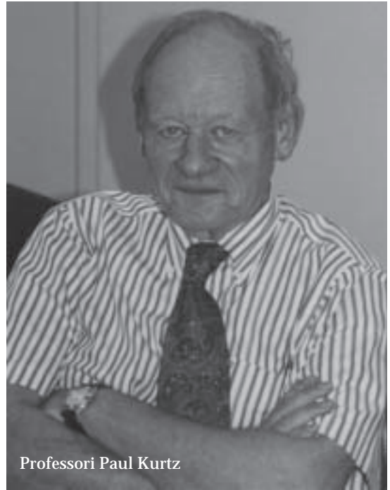
Professori Paul Kurtz

Maailmankuulu skeptikko ja humanisti Paul Kurtz perustelee oheisessa artikkelissaan, miksi termi ”skeptikko uskonnollisten väittämien suhteen” on sattuvampi kuin termi ateisti. Siksi, että se korostaa asioiden tutkimista, hän sanoo. Artikkelin on aiemmin julkaistu Rationalist International Bulletin -lehdessä 27. heinäkuuta 2006