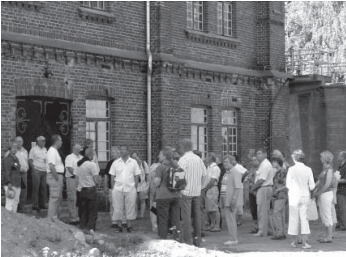
Kesäpäivien viettäjät tutustumassa Verlan tehdasmuseoon

tarkoitus koostaa materiaali, josta löytyisi tietoa eri tarkoituksiin.