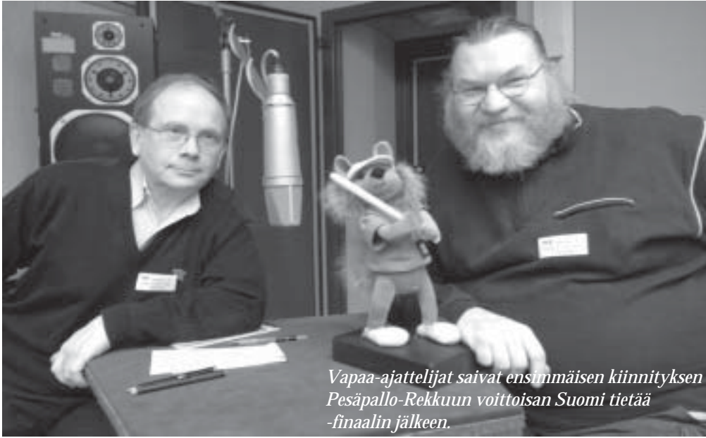
Vapaa-ajattelijat saivat ensimmäisen kiinnityksen Pesäpallo-Rekkuun voittoisan Suomi tietää -finaalin jälkeen.