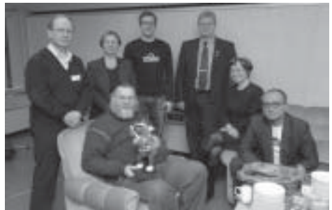
Ylen Suomi tietää -kisan finalistit. Vasemalla kuvassa voittoisat vapaa-ajattelijat.