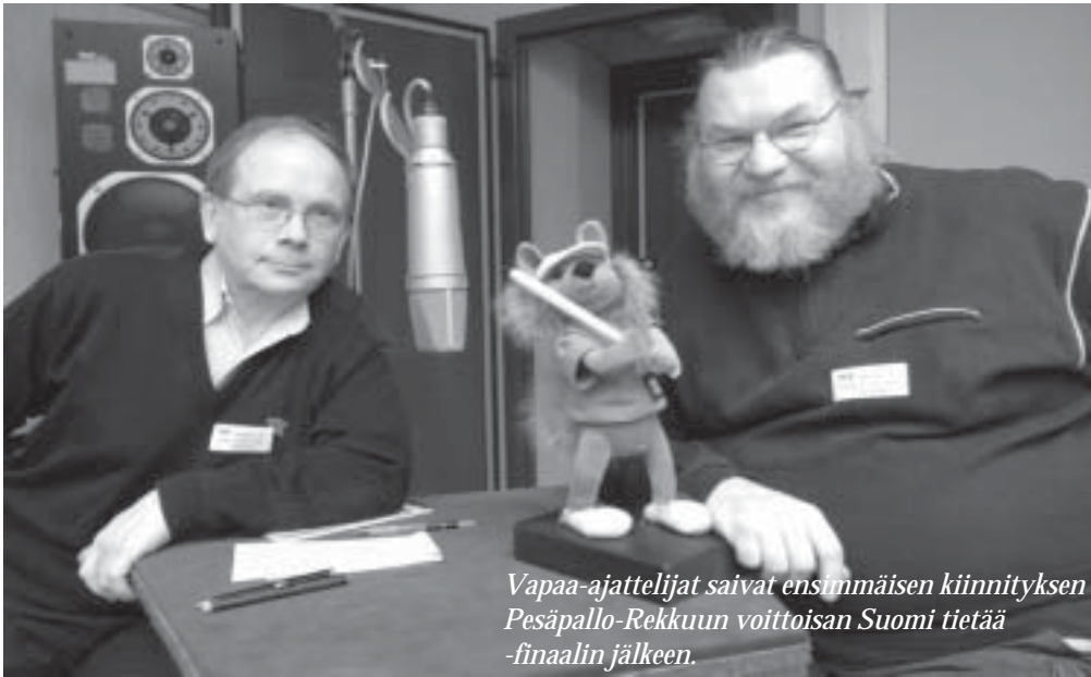
Vapaa-ajattelijat saivat ensimmäisen kiinnityksen Pesäpallo-Rekkuun voittoisan Suomi tietää -finaalin jälkeen.