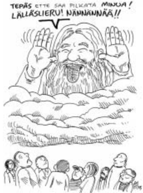
Jumalat tuntuvat sietävän huonosti kritiikkiä. Ks. myös sivu 24