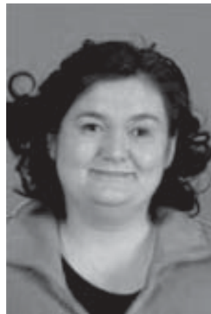
Kansanedustajat Irina Krohn (yllä) ja Rosa Meriläinen (alla)

– Lasten uskonnollinen ja katsomuksellinen kasvatusta on ensisijaisesti kotien ja oman uskonnollisen yhteisön tehtävä. Nykymuotoinen uskonnon opetus