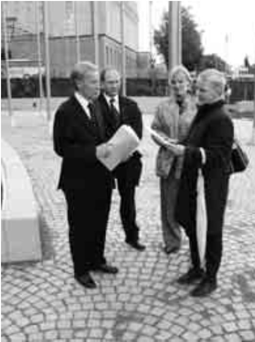
Janna Vainio (teksti & kuva)