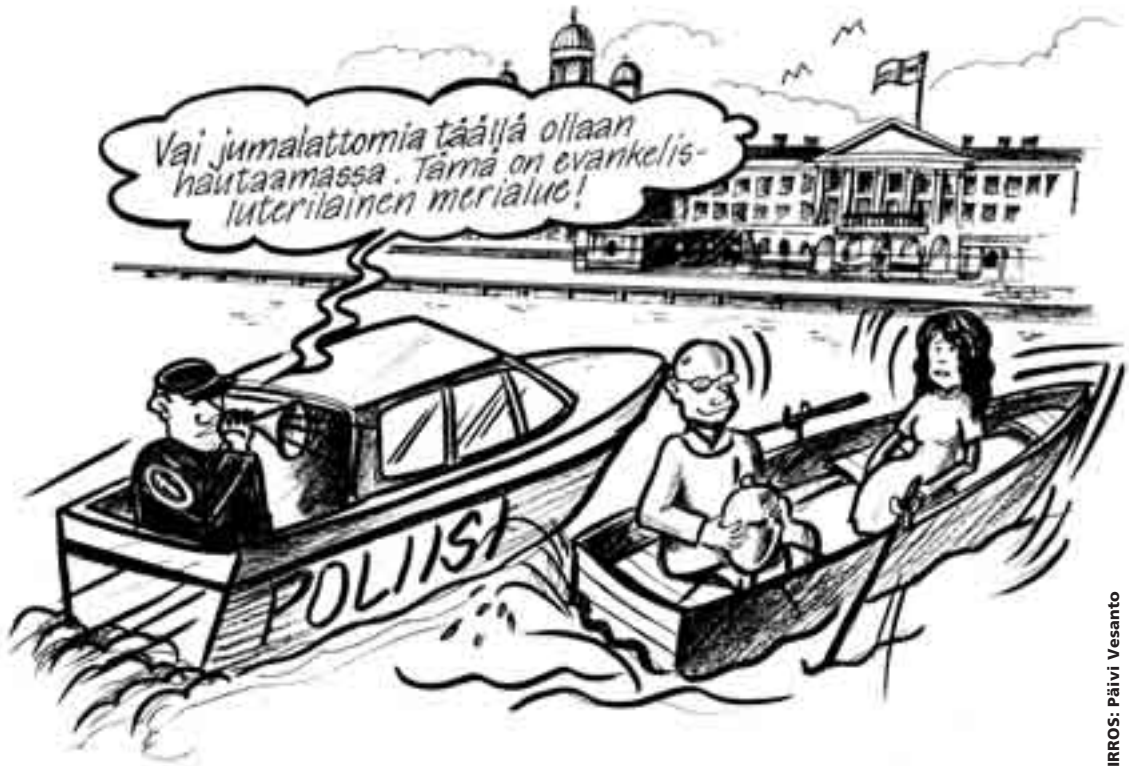
PIIRROS: Päivi Vesanto