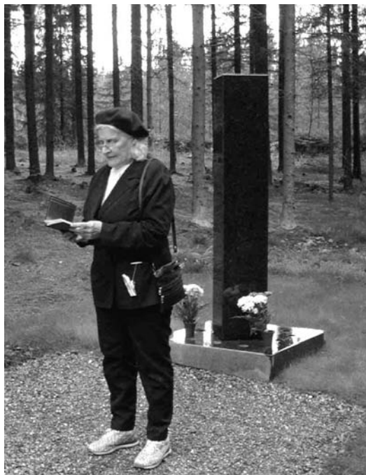
Janna Vainio (teksti & kuva)