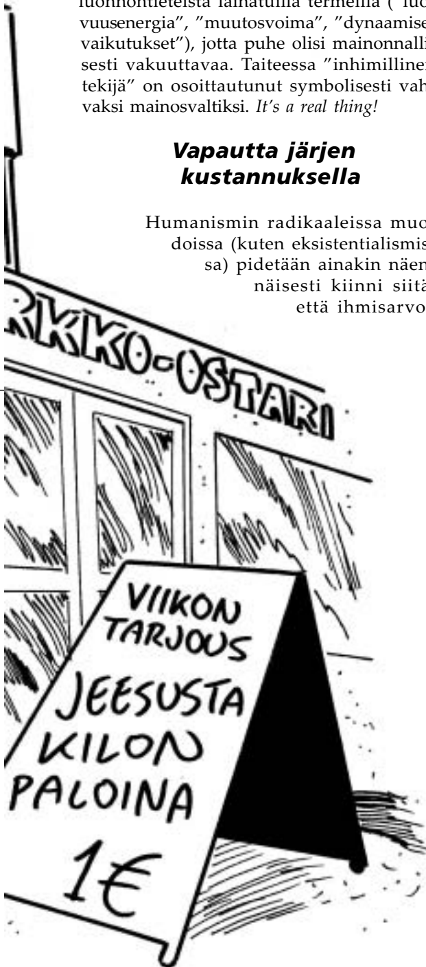
Piirros: P.A. Manninen

Perinteisesti humanistiset ideologiat ovat olettaneet, että ihmisenä oleminen merkitsee kokemuksena joillakin perustavilla tavoilla samaa paikasta ja ajasta riippumatta. Humanismin kertomus pohjautuu uskomukseen, että ”ihmisyyttä” subjektiivisena olotilana merkitsee kaikille ihmisille jollakin selittämättä jäävällä tavalla samaa. Vastavasti oletukset jostakin kaikille samalla tavoin yhteisestä ”naisuudesta” tai ”miehuudesta” tai oletus työväenluokan universaalista tehtävästä ovat tyypillisiä modernin humanismin perusoletuksia. Feminismi ja sosialismi ovat saman valistushumanistisen