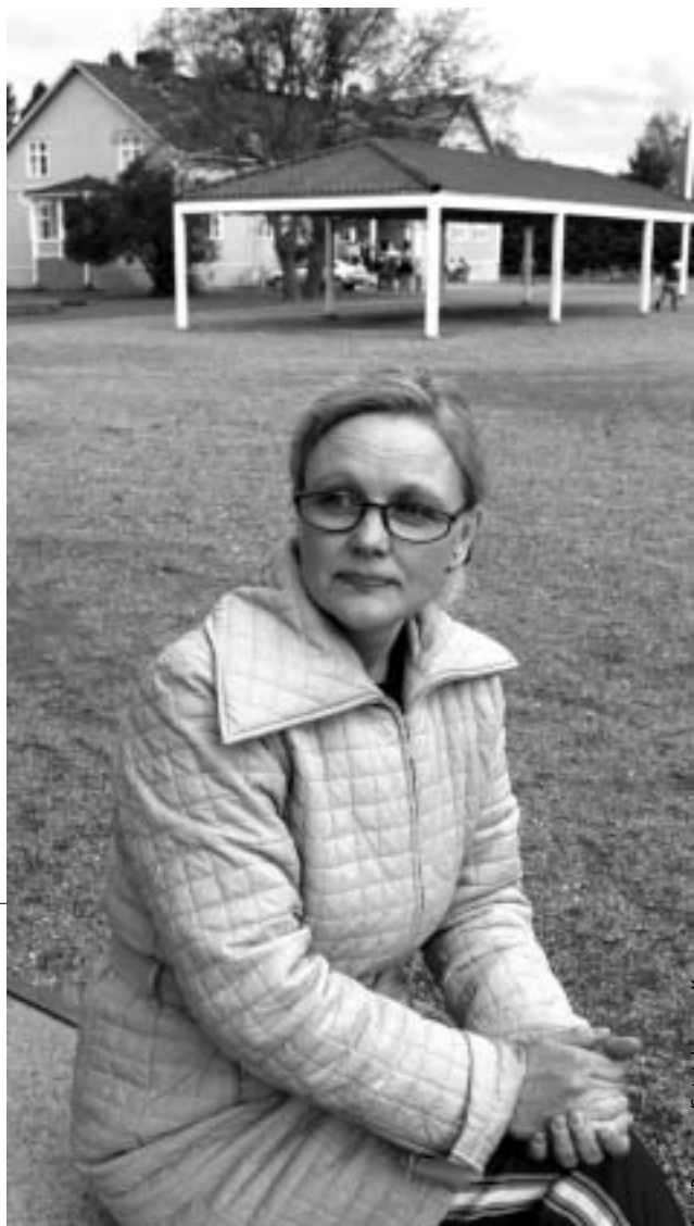
Jussi Partanen/Satakunnan Kirisa